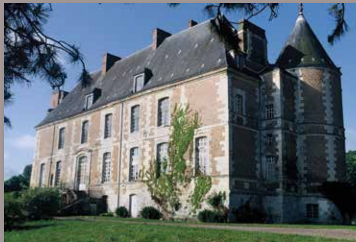
Château de Fosseuse